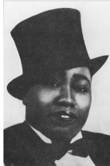
Gladys Bentley, una figura importante en el movimiento “cross dress” de los 1920s en Nueva York

sentimientos conflictivos que Lorca estaba experimentando en esta época de su vida. Según Binding, y Mabrey, entre otros, Lorca, entre los años 1929-1930, estaba en medio de una crisis de amor y sexualidad que contribuyó a una visión más oscura en las obras de esta época. La escena queer fue especialmente chocante para Lorca. Según Gay New York , la ciudad estaba llena de bares para la gente queer quienes no se conformaban a la heterosexualidad o las normas del género binario. Lorca seguramente habría observado mucha gente gay o transgénera, unos drag queens y kings , y varias lesbianas. Como Lorca frecuentaba el barrio de Harlem cerca de la Universidad de Columbia, 4 se hubiera encontrado con una escena queer y además, multi-racial. El hecho de que su relación con Salvador Dalí (Mabrey 84) había fracasado para aquel entonces también contribuye a que “Oda” refleje sus dudas y emociones en cuanto a su propia identidad. Quizás lo único en que todos los críticos concuerdan concretamente en cuanto a “Oda” 5 es que es profundamente dualista 6 , con tensión entre la naturaleza y