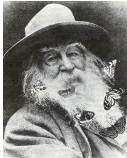
“Fotomontaje de la cabeza de Walt Whitman” de Caballo azul de mi locura por Gibson, página 243

Whitman aquí es el “viejo hermoso” de la naturaleza, con su “barba llena de mariposas” y sus “hombros de pana gastados por la luna”. La voz poética de Lorca se une a la de Whitman; la luna y las mariposas son símbolos asociados con la poesía de Whitman 8 tanto como la de Lorca, que también usaba las imágenes de la luna y de las mariposas. Dice Binding: “for Lorca, the butterfly is an emissary from the Ideal world” (Binding 136). A pesar de esta comunión intelectual, poética—opina Binding—Lorca resistía aceptar la sexualidad de Whitman en términos de sus